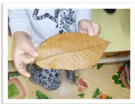
"SEMBRA UNA FRECCIA"