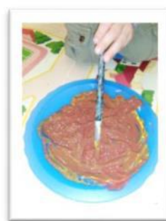
"E' COME LA POZIONE MAGICA"