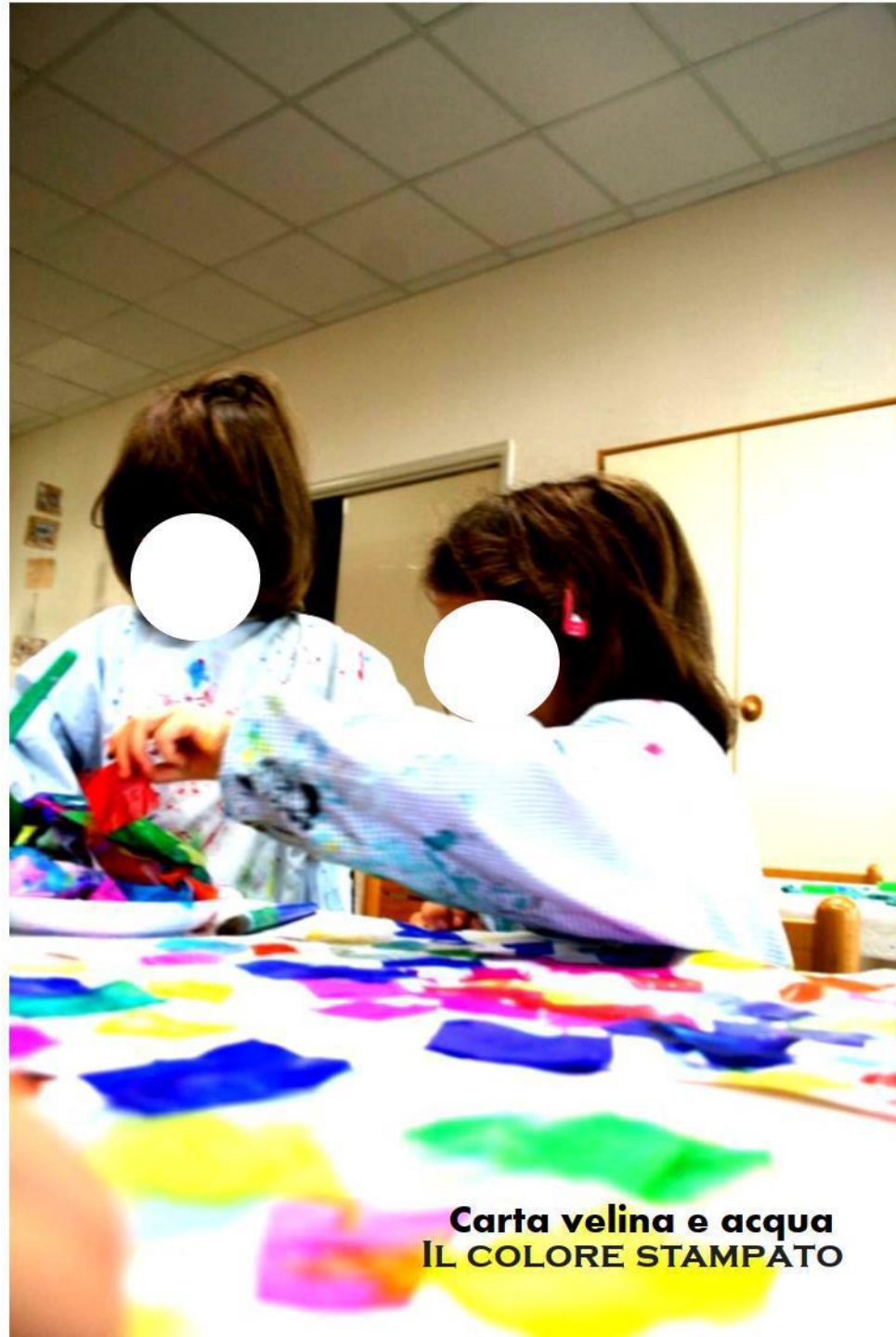
Carta velina e acqua IL COLORE STAMPATO