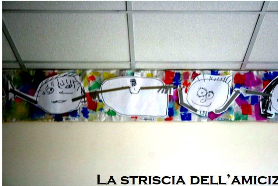
LA STRISCIA DELL'AMICIZIA Tutti per mano